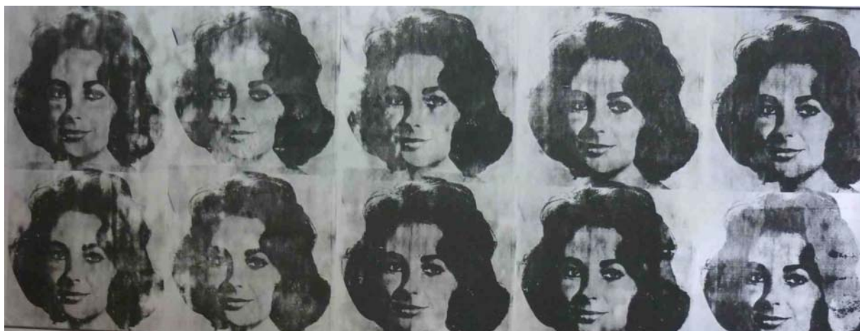
Ten Lizes, encre sérigraphique et peinture à la bombe sur toile, 1963

En 1963, il ouvre la factory dans une usine désaffectée. C'est un lieu étrange dont les murs sont recouverts d'aluminium et dont l'usage est multiple, à la fois atelier, studio d'enregistrement, lieu de rencontre pour de nombreux artistes, salle de spectacle pour le groupe rock The Velvet Underground. La factory changera plusieurs fois d'adresse.