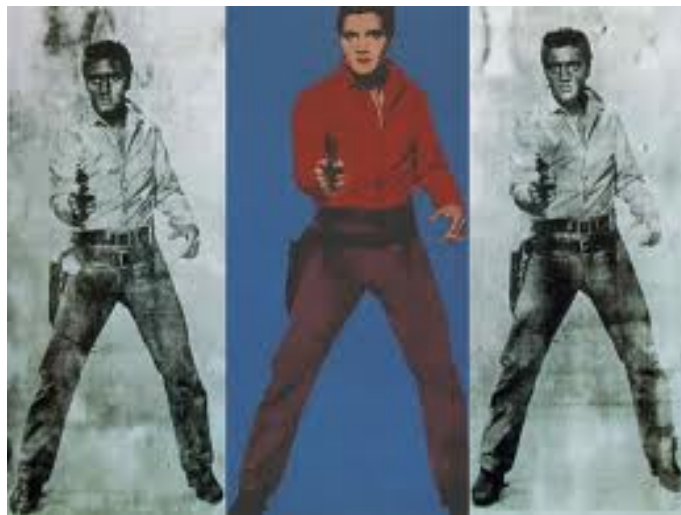
Elvis - Trilogie