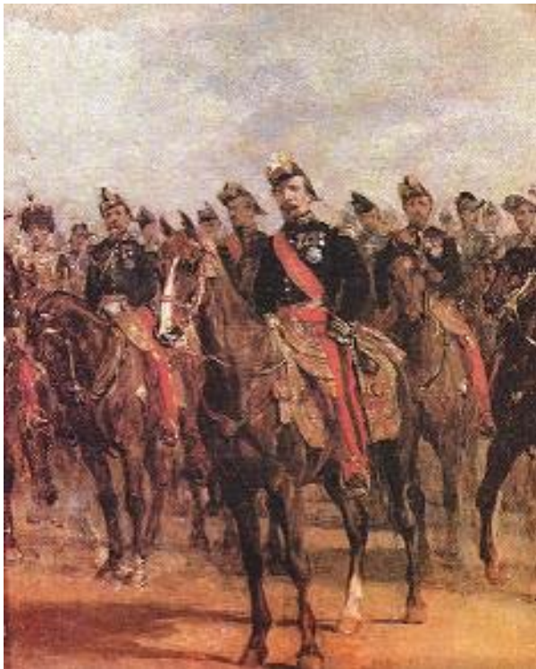
Napoléon III entouré du Grand Etat-major

les toiles. Elles ont vraisemblablement commencées à être sculptées après la campagne d'Italie de Napoléon III, car leur thème est surtout militaire.