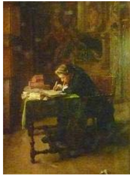
Le jeune écrivain-