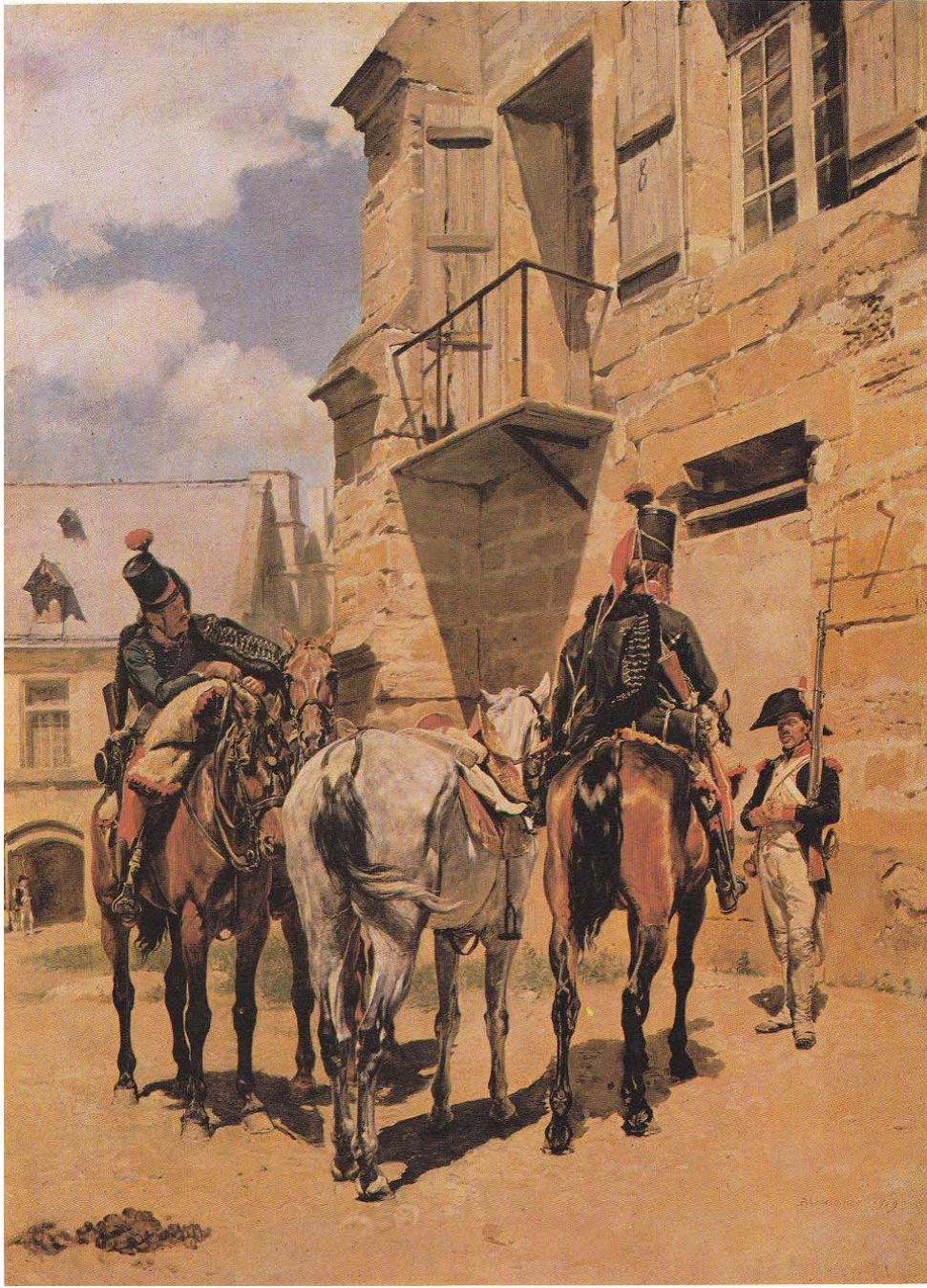
Ordonnances à cheval