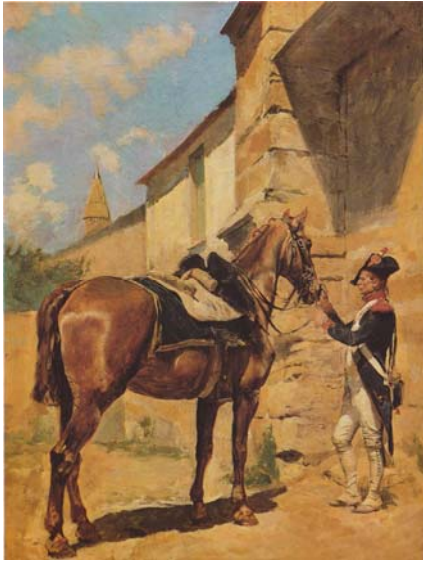
Le cheval de l'ordonnance