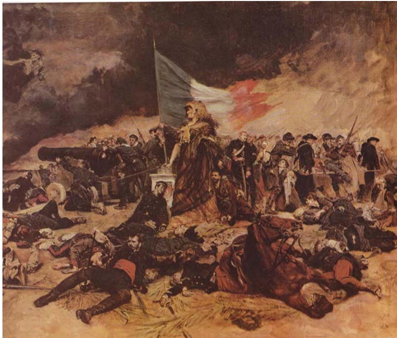
A la gloire des combattants durant le siège de Paris

d'un tableau immortalisant Le siège de Paris en 1871. Mais il ne reprendra ce tableau que bien plus tard pour le terminer, en 1884.