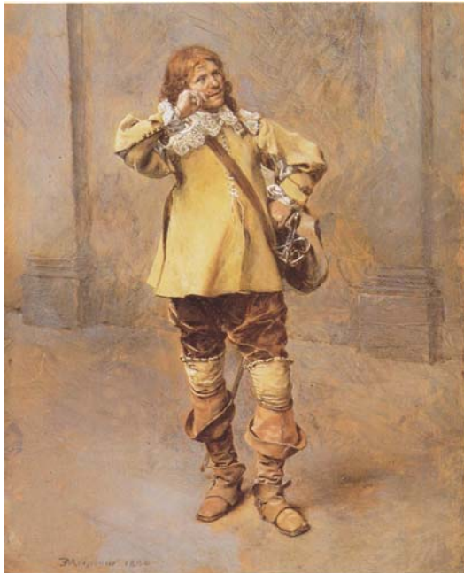
Gentilhomme frisant sa moustache

En 1834, il fait un séjour à Rome pour se perfectionner. Il commence à se faire connaître par ses vignettes illustrant des d'ouvrages et il s'impose rapidement comme un illustrateur de talent. Il va notamment illustrer deux publications de Bernardin de Saint-Pierre, Paul et Virginie et La chaumière indienne . Il fera aussi partie des illustrateurs d'Honoré de Balzac avec cinq dessins pour la Comédie humaine : La Maison du chat-qui-pelote , Le Bal de Sceaux , La Bourse , La Femme abandonnée , La Femme de trente ans . Pour la réalisation de chaque petite miniature, il se livre à travail de documentation très précis, passant des journées entières à la bibliothèque nationale.