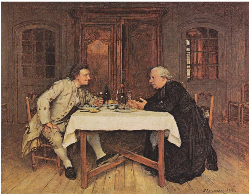
Le vin du curé