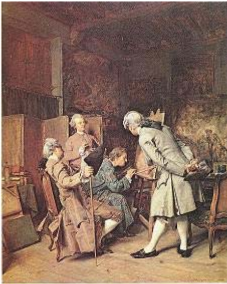
Le peintre et ses admirateurs