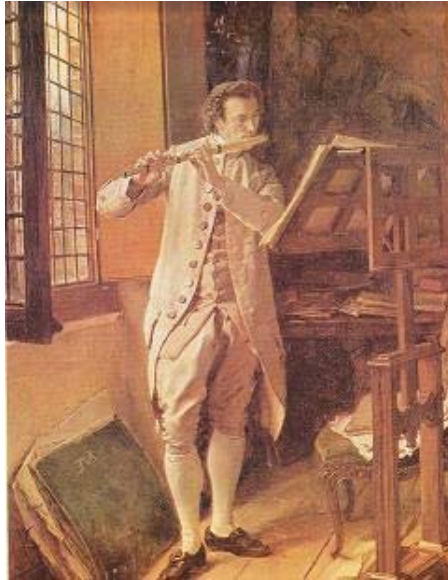
Le joueur de flûte

Mais, il ne fait que de l'atelier de Cogniet, seul au Louvre où il se pour recopier les maîtres. Parallèlement, dessinant, avec Louis-Auguste Steinheil (dont 1838), des images calendriers et des marchands de la rue